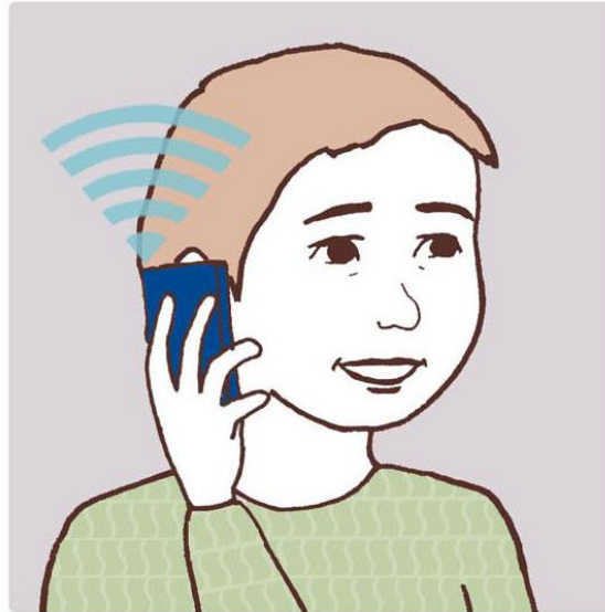
Telefon 40 DKK