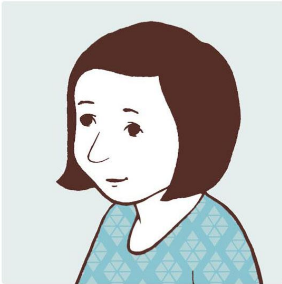
Personlig oppmøte 80 DKK