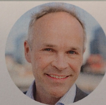
Jan Tore Sanner Kommunal- og moderniseringsminister

Alt som kan digitaliseres vil bli digitalisert. Dette gjelder også i høyeste grad offentlig sektor. Vi må se på hvordan vi kan fornye, forenkle og forbedre offentlig sektor og bruke IKT til å fjerne tidstyvene. Her har regjeringen et stort ansvar som vi tar veldig alvorlig. Dette vil bli et sentralt tema på IT-tinget 2014.